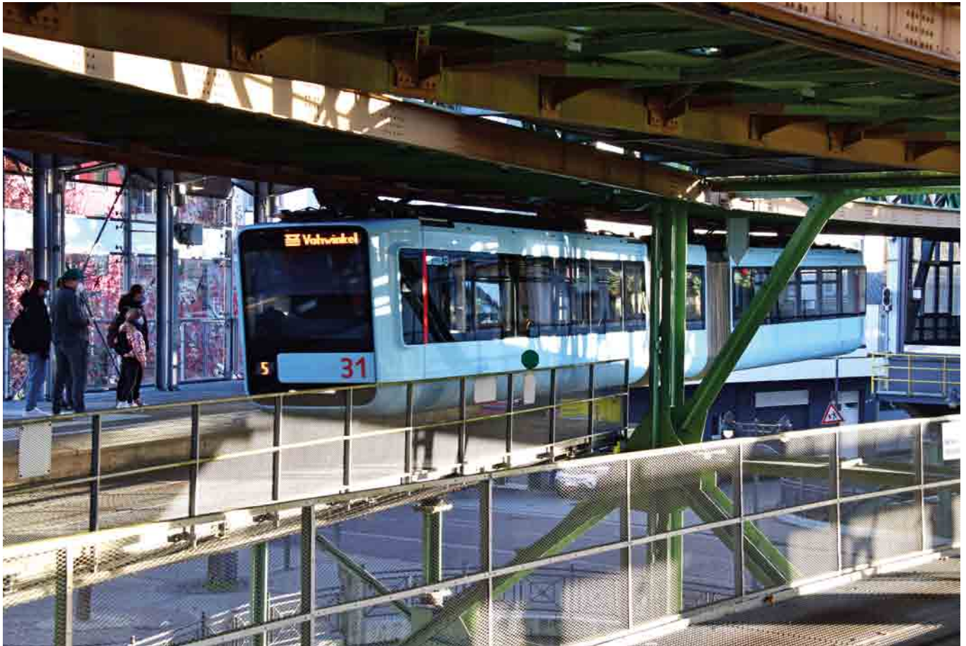
Sæt 31 „svæver“ til perron på den nordlige endestation Oberbarmen. Passagerer bruger stadig mundbind i november 2022. Herunder sæt 15 på vej til Oberbarmen i det øjeblik, hvor banen svinger ud af Sonnborner Straße og ind over floden Wupper. I baggrunden kører et af DB's S-tog hen over den firsporede jernbanebro.

Se flere billeder fra Wuppertal på: www.hauerslev.com .